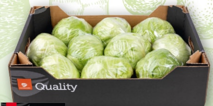
Eisbergsalat Spanien, Klasse I, Kaliber 450–600 g 196 746 10er-Kiste