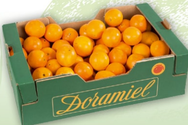
Saftorangen Valencia Ägypten, Klasse II, Kaliber 5–7 101 012 15-kg-Kiste