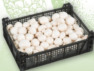
Champignons weiß Polen, Klasse I, Kaliber 30–65 574 582 3-kg-Kiste

Das gesamte Selgros-Team freut sich auf Deinen Besuch!