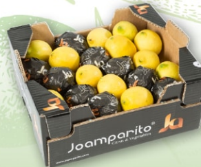
Zitronen Spanien, Klasse I 382 152 5-kg-Kiste