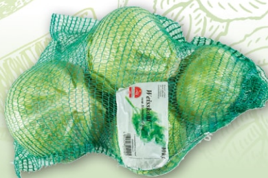
Weißkohl Deutschland, Klasse II 276 957 10-kg-Sack