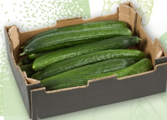
Gurke Spanien/Niederlande, Klasse I, 300–400 g 415 208 14er-Kiste