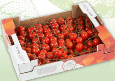
Tomate Cherrystrauch Italien, Klasse I 547 786 3-kg-Kiste