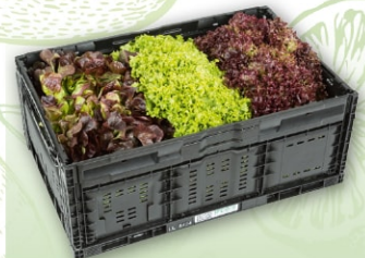
Mix Salat Italien, Klasse I, 275–375 g 415 553 9er-Kiste