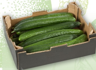
Gurke Spanien/Niederlande, Klasse I, 300–400 g 415 208 14er-Kiste