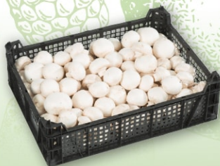
Champignons weiß Polen, Klasse I, Kaliber 30–65 574 582 3-kg-Kiste

Das gesamte Selgros-Team freut sich auf Deinen Besuch!