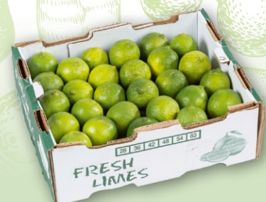
Limetten Brasilien, Klasse I 230 689 4-kg-Kiste