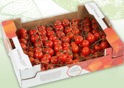
Tomate Cherrystrauch Italien, Klasse I 547 786 3-kg-Kiste