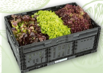
Mix Salat Italien, Klasse I, 275–375 g 415 553 9er-Kiste