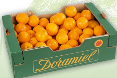
Saftorangen Valencia Ägypten, Klasse II, Kaliber 5–7 101 012 15-kg-Kiste