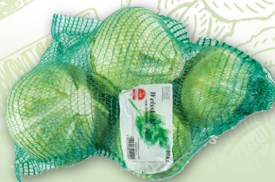
Weißkohl Deutschland, Klasse II 276 957 10-kg-Sack