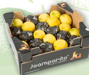
Zitronen Spanien, Klasse I 382 152 5-kg-Kiste