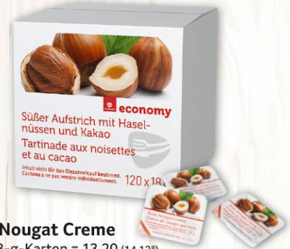
Nuss-Nougat Creme 120 x 18-g-Karton = 13.20 (14.12*)