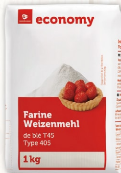
Weizenmehl Typ 405