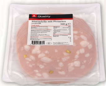
Mortadella mit Pistazien Kaliber 160 mm

Transgourmet Quality bietet das umfassende Sortiment für den Profikoch!