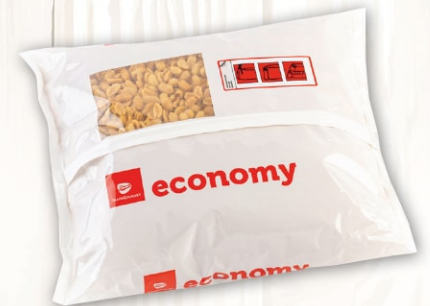
Erdnüsse geröstet und gesalzen, 2,5-kg-Beutel = 12.48 (13.35*)