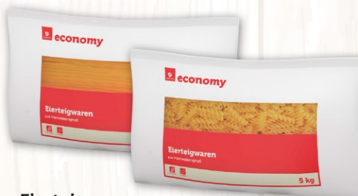
Eierteigwaren 10 % Eianteil, verschiedene Ausformungen, 5-kg-Beutel = 8.95 (9.58*)