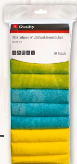
Mikrofaser-tuch 30 x 30 cm