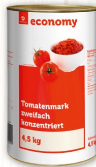
Tomatenmark 2-fach konzentriert