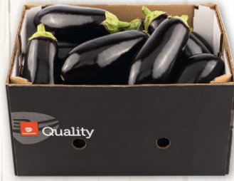
Auberginen, violett Klasse I, Belgien, 300-400 g