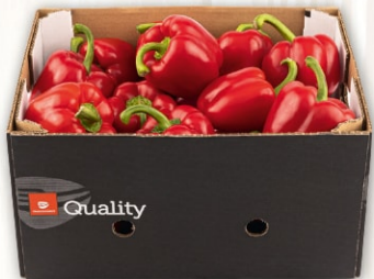
Paprika, rot Klasse I, Spanien, 80-100