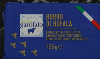
fattorie garofalo Burro di Bufala Büffelbutter, 82 % Fett 915 912 125-g-Packung