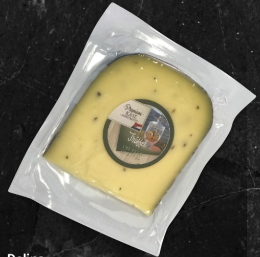
Delina Käse mit Trüffel 48 % Fett i. Tr. 507 337 250-g-Packung