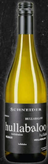
Michael Schneider Hullabaloo trocken 297 180 0,75-l-Flasche