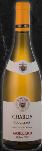
Moillard Coquillage Chablis AOC Frankreich-Bourgogne, trocken 781 970 0,75-l-Flasche