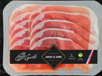
Corte Gusto Jambon de Savoie 320 973 100-g-Packung