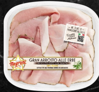
Negrini L'Essenza Arrosto alle Erbe 82 583 110-g-Packung