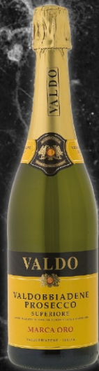
Valdo Prosecco Spumante Superiore Marca oro, extra dry 361 378 0,75-l-Flasche