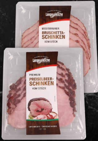
Langewiesche Preiselbeer- oder Bruschetta- schinken 151 268 100-g-Packung