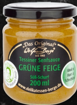
Tessiner Senfsauce verschiedene Sorten 333 377 200-g-Glas