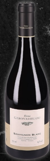
Ktima Gerovassiliou Sauvignon Blanc Griechenland, trocken 949 992 0,75-l-Flasche