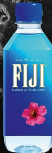
Fiji Water still 274 899 1-l-PET-EW-Flasche +Pfand