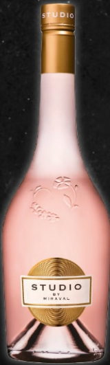
Studio by Miraval Rosé Frankreich-Provence, trocken 999 304 0,75-l-Flasche