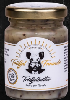
Trüffel Freunde Trüffelbutter 10 % Trüffel 844 579 75-g-Glas