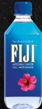
Fiji Water still 866 726 0,5-l-PET-EW-Flasche +Pfand