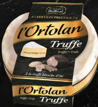
l'Ortolan Französischer Trüffel-Weichkäse 55 % Fett i. Tr. 83 109 135-g-Packung