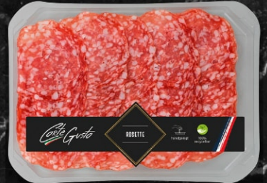
Corte Gusto Salame Rosette 441 353 100-g-Packung