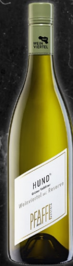
Pfaffl Grüner Veltiner Reserve „Hund“ 652 334 0,75-l-Flasche