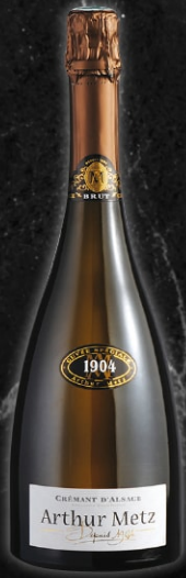
Arthur Metz Crémant D'Alsace Cuvée Speciale 1904 brut 328 424 0,75-l-Flasche