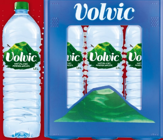
Volvic Naturelle 885 683 6 x 1,5-l-PET-MW- Flasche 0.88 (1.05*) / Flasche +Pfand