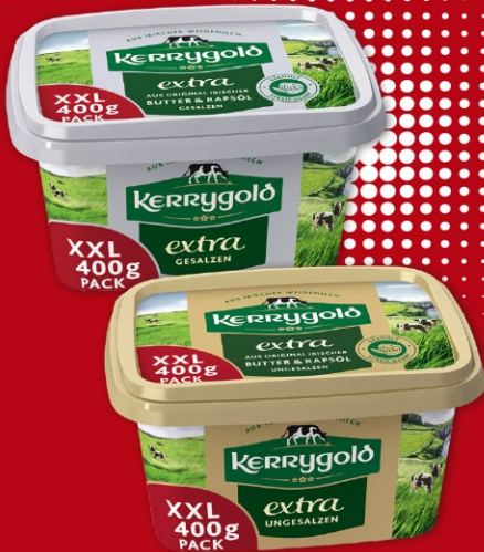
Kerrygold extra gesalzen oder ungesalzen 752 466 400-g-Becher