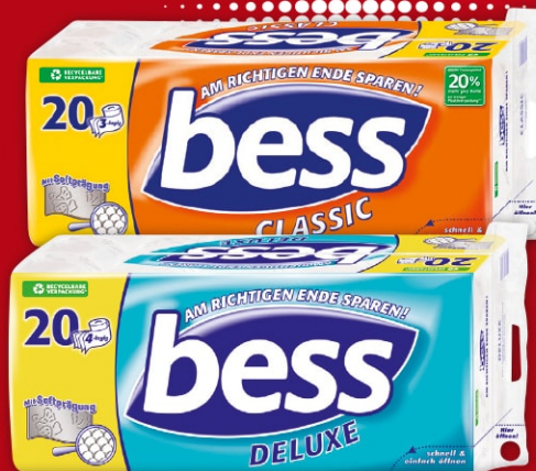
Bess Toilettenpapier Classic 3-lagig oder Deluxe 4-lagig 981 692 20 x 180/150-Blatt-Packung