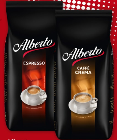
Alberto Espresso oder Caffè Crema ganze Bohne 229 302 1-kg-Beutel