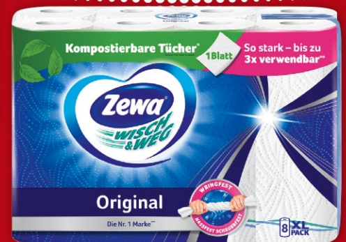
Zewa Wisch & Weg Küchentücher verschiedene Sorten, 8 x 45 Blatt oder Smart 4 x 90 Blatt 484 210 Packung