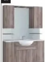
Badblock „Elba“ (Abb. ähnlich)