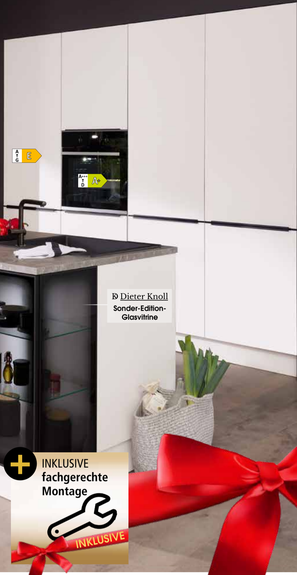
Dieter Knoll Sonder-Edition- Glasvitrine